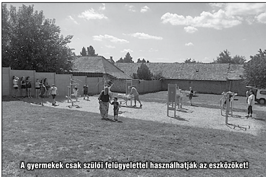
A gyermekek csak szülői felügyelettel használhatják az eszközöket!

Vértesszőlős Község Önkormányzata a Vértesszőlős Község közreműködésével, 4,75 millió forint pályázati összegből Sportparkot létesített az iskola udvarán, ahová összesen 9 eszköz lett kihelyezve. A terület zárt helyen található, közúttól távol. Az augusztusi, hivatalos átadást követően birtokba vehették kicsik és nagyok, a falu lakossága és minden érdeklődő.