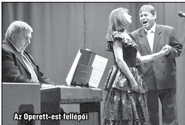
Az Operett-est fellépői