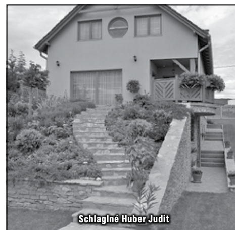
Schlaginé Huber Judit