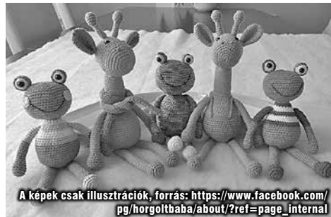
A képek csak illusztrációk, forrás: https://www.facebook.com/pg/horgoltbaba/about/?ref=page_internal

Jó hír szintén erre a szép ünnepi készülődésre, hogy Jótékonyági kötőklubunk szorgos kezű tagjai csodálatos kis amigurumi figurákkal készülnek a Falukarácsonyra. Eladásukból származó bevételt az óvo-