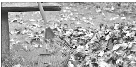
NHSZ Vértesszőlő Vidéke Hulladékgazdálkodás Nonprofit Kft. 2023. évi hulladéknaplára

Az NHSZ Vértesszőlő Vidéke Hulladékgazdálkodási Nonprofit Kft. 2022. november 3-ai zöldhulladék szállítást követően 2022. DECEMBER 2-ÁN ZÖLDHULLADÉK PÓTSZÁLLÍTÁST SZERVEZ Vértesszőlő településen. A megmaradt zöldhulladékot az eddigiekhez hasonlóan kötegelve vagy zsákolva kell kihelyezni az ingatlanok elé, legkésőbb a szállítási napon reggel 6 óráig.