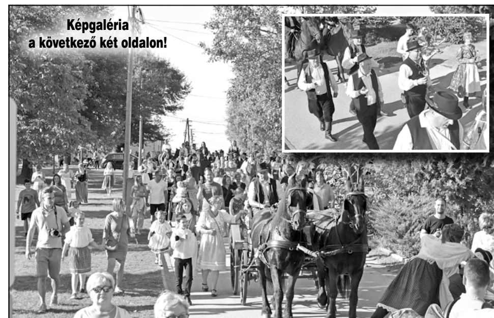
Képgaléria a következő két oldalon!