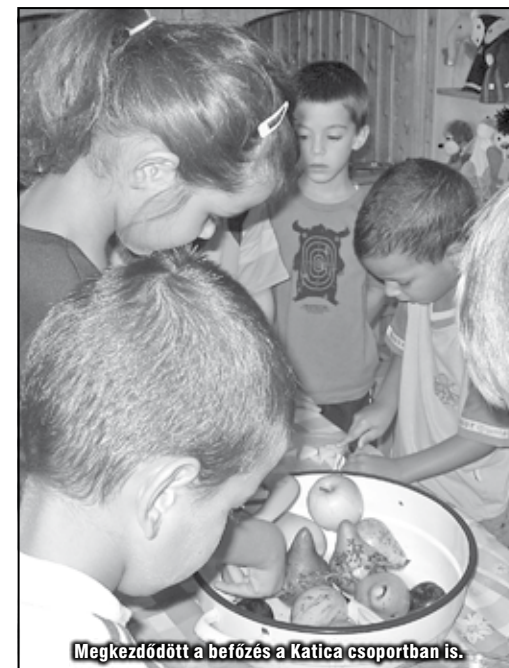
Megkezdődött a befőzés a Katica csoportban is.