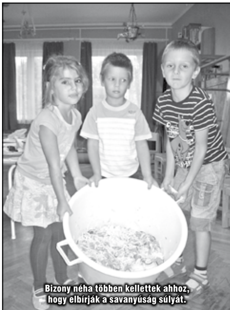
Bizony néha többen kellett ahhoz, hogy elbírják a savanyúság súlyát.