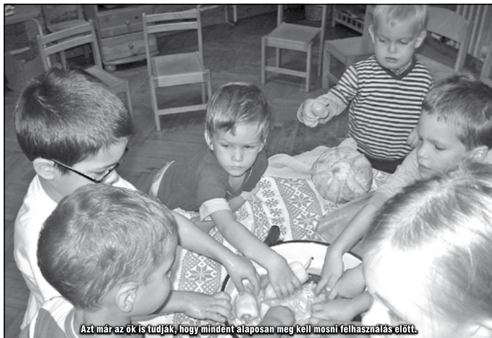
Azt már az ők is tudják, hogy mindent alaposan meg kell mosni felhasználás előtt.