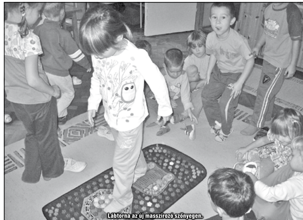
Lábtorna az új masszírozó szőnyegen.

is nagyon köszönünk. A láb tornázására eddig is nagy gondot fordítottunk, ezzel az eszközzel még változatosabb lesz ez a mozgásforma.