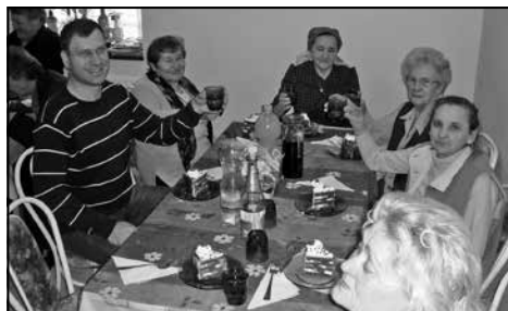
A Klub dolgozói