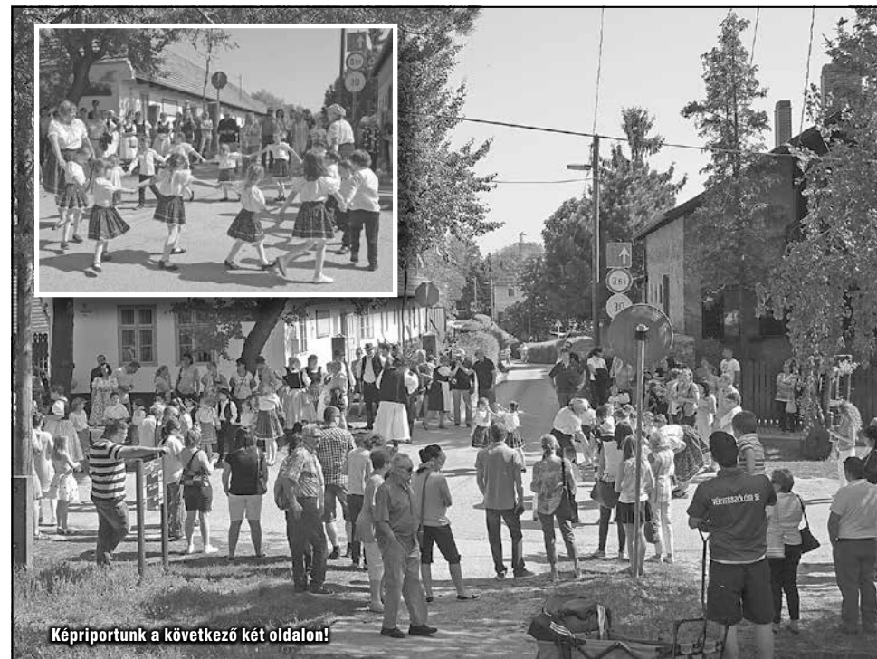
Képriportunk a következő két oldalon!